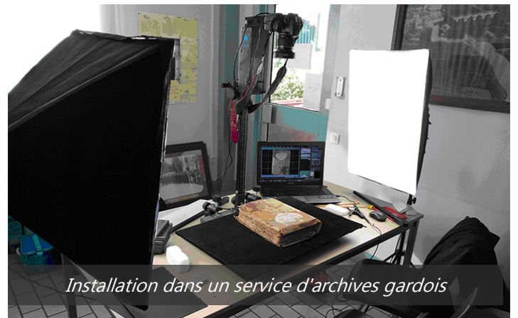
Installation dans un service d'archives gardois

Aigues-Vives, Boissières, Congénies, Marguerites, Moussac, Saint-Chartes ou Sommières font partie des communes gardoises qui ont fait le choix de numériser et de publier leurs archives.