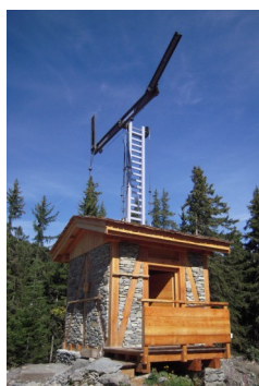
Plan de l'Ours.

► Ligne Paris - Turin (1807) • Association Moulins et Patrimoine de Saint-André • 177 chemin de la Plume • 73500 Saint-André • Tél. : 04 79 05 23 35 ou 04 79 05 27 58 • Courriel : d.benard2@wanadoo.fr • Site : www.moulins-telegraphe-chappe-st-andre.fr •